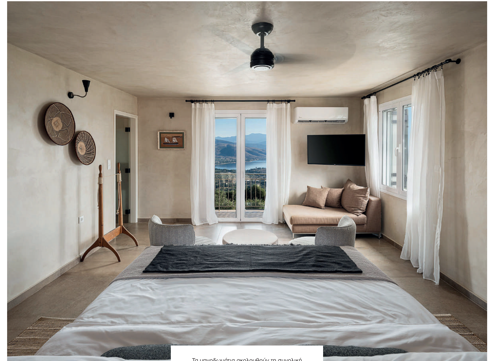
Τα υποδωμάτια ακολουθούν τη συνολική αρχιτεκτονική γλώσσα της κατοικίας, με ήπιους τόνους, λιτές γραμμές και ανεμπόδιση θέα προς το φυσικό περιβάλλον.