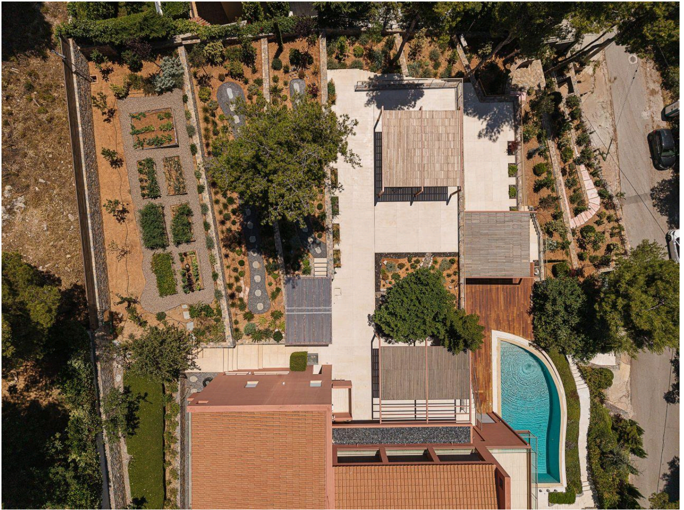
Αεροφωτογραφία του σπιτιού