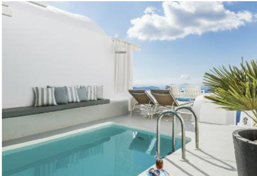
Architectural Design: PALY architects: Nikos Lykoudis, Ismene Papaspiliopoulou Collaborating architects: Eleftheria Chatzi, Marina Gkolfomitsou, Konstantinos Platyrachos