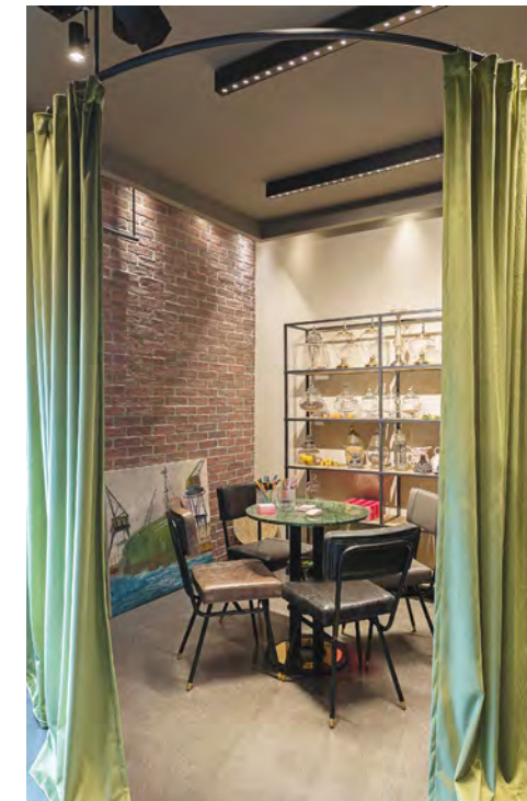
ΟΙ ΔΙΑΧΩΡΙΣΤΙΚΕΣ ΚΟΥΡΤΙΝΕΣ ΠΡΟΣΦΕΡΟΥΝ ΕΝΑΝ ΕΥΜΕΤΑΒΛΗΤΟ ΧΑΡΑΚΤΗΡΑ ΣΤΟΥΣ ΧΩΡΟΥΣ ΕΡΓΑΣΙΑΣ ΚΑΙ ΣΥΝΑΝΤΗΣΕΩΝ.