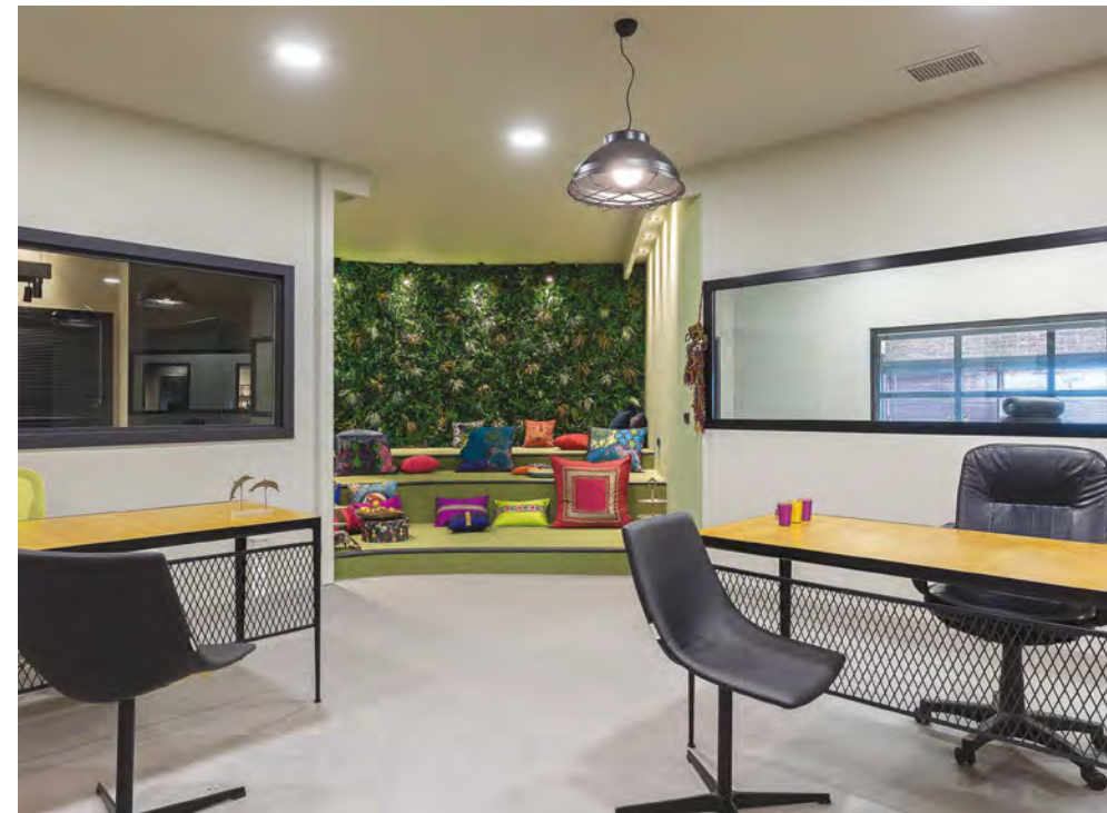
ΟΙ ΕΠΙΛΟΓΕΣ ΤΩΝ ΧΡΩΜΑΤΩΝ ΚΑΙ ΤΩΝ ΥΛΙΚΩΝ ΕΚΦΡΑΖΟΥΝ ΤΗΝ ΕΤΑΙΡΙΚΗ ΤΑΥΤΟΤΗΤΑ, ΔΙΝΟΝΤΑΣ ΠΑΡΑΛΛΗΛΑ ΤΗΝ ΑΙΣΘΗΣΗ ΤΗΣ ΟΙΚΕΙΟΤΗΤΑΣ.

μένων και επισκεπτών αποτέλεσε κύρια πρόθεση του σχεδιασμού. Η χρήση κουρτινών στους κοινόχρηστους χώρους προσφέρει τη δυνατότητα δημιουργίας διαφορετικών χώρων εργασίας και συνάθροισης, συνθέτοντας μια ποικιλία χώρων, με στόχο τη βελτίωση της διάθεσης των εργαζομένων και τη μεγιστοποίηση της απόδοσής τους. Η συνθετική λογική των καταστημάτων και η ποικιλία των υλικών που διαθέτουν έχουν μεταφερθεί και στους χώρους γραφείων. Στους κοινόχρηστους χώρους των γραφείων οι επιλογές των επίπλων, των υλικών και των χρωμάτων δημιουργούν την αίσθηση του οικείου μέσω της χρήσης φυσικών και φιλικών υλικών: εμφανών τούβλων και τσιμεντοκονιαμάτων σε γκρι χρώμα στους τοίχους, ξύλου τύπου OSB και μαύρου μετάλλου στις επενδύσεις, μωσαϊκών στα δάπεδα και μεταλλικών αναρτημένων πλεγμάτων στις οροφές. Τα έπιπλα, ο φωτισμός και οι διαχωριστικές κουρτίνες προσδίδουν επιπλέον χρώμα και ενισχύουν την αίσθηση ηρεμίας στο χώρο. Αντικείμενα που πωλούνται στα καταστήματα, τοποθετημένα σε ραφιέρες, λειτουργούν συμπληρωματικά και υπογραμμίζουν την ταυτότητα των χώρων.