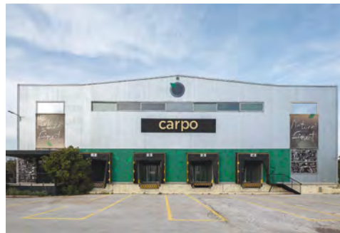
Η ΚΥΡΙΑ ΟΨΗ ΤΟΥ ΚΤΙΡΙΟΥ.

ΑΡΧΙΤΕΚΤΟΝΙΚΗ ΜΕΛΕΤΗ: PALY ARCHITECTS ΥΠΕΥΘΥΝΟΣ ΜΕΛΕΤΗΣ: ΝΙΚΟΣ ΛΥΚΟΥΔΗΣ ΟΜΑΔΑ ΜΕΛΕΤΗΣ: ΝΙΚΟΣ ΛΥΚΟΥΔΗΣ, ΙΣΜΗΝΗ ΠΑΠΑΣΠΗΛΙΟΠΟΥΛΟΥ, ΚΩΝΣΤΑΝΤΙΝΟΣ ΠΛΑΤΥΡΡΑΧΟΣ, ΣΟΦΙΑ ΠΕΡΠΙΝΙΑ ΕΜΒΑΔΟ: 545 m 2 ΧΡΟΝΟΣ ΜΕΛΕΤΗΣ: 2018 ΧΡΟΝΟΣ ΚΑΤΑΣΚΕΥΗΣ: 2019 ΤΟΠΟΘΕΣΙΑ: ΚΟΡΩΠΙ, ΑΤΤΙΚΗ